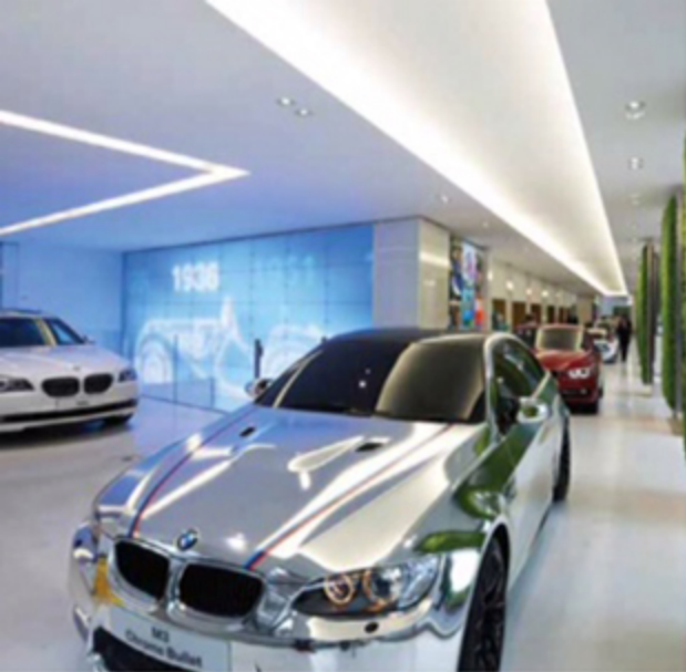
Nas boutiques da BMW, o escritório empregou técnicas digitais inovadoras para refletir os atributos da marca