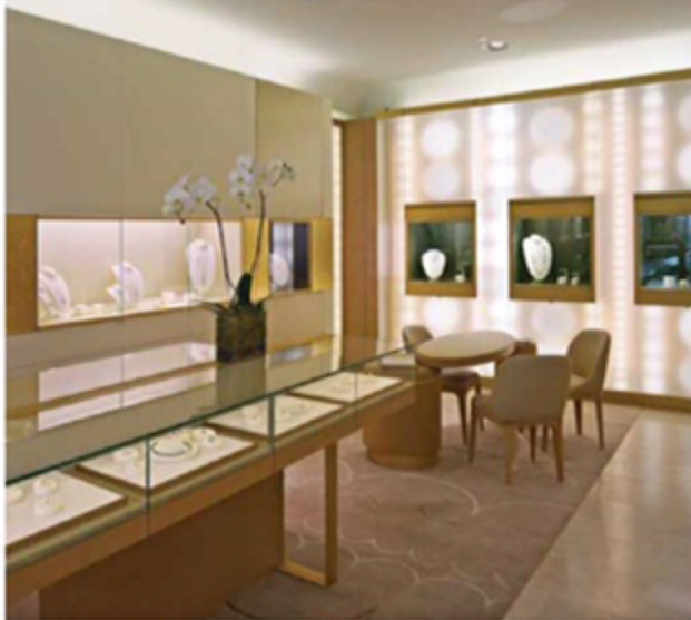
A Carbondale priorizou o design e a luz para valorizar as pérolas neste projeto para a joiaheria Paspaley

COMO: Na BMW de Londres foram arquitetados atributos da imagem da marca na fachada do edifício com uma solução digital usando painéis de LCD que se tornam opacos e transparentes através de uma programação orquestrada de carga elétrica. Além disso, os 78 metros de comprimento da fachada estão cobertos com 20 painéis de LCD do tamanho da coluna que mostram uma rítmica animação dos carros exibidos dentro da loja. Já para a concessionária da avenida George V, em Paris, a Carbondale criou técnicas digitais inovadoras integradas na arquitetura e experiência do espaço, como a sala principal, onde estão expostos os carros dentro de esculturas de redemoinhos digitais de luzes LED programadas dentro do teto e em fios de alumínio. O movimento de luz e cor é personalizado para cada modelo, reproduzindo um sentido de movimento no exterior e interior do carro. Em Nova Iorque, o showroom da BMW foi pensado para superar a capacidade criada pelo vidro do canto da fachada, que é altamente reflexivo.