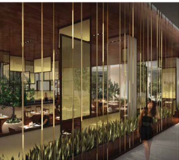
O conceito "Restaurant in the Garden" explora a atmosfera ao ar livre no Pivellino