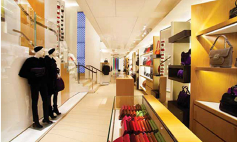
Na loja icônica de Louis Vuitton em Paris, a área de 1.800 metros quadrados foi transformada em uma sequência de boutiques intimistas

5. QUEM: Louis Vuitton. O QUÊ: A boutique icônica. ONDE: Paris.